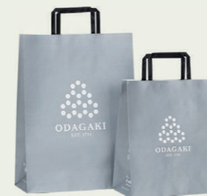
【手提げ大】 【手提げ小】

・贈答用商品(化粧箱入り商品)をご注文者様にお送りする場合は1商品につき1枚お付けしております。